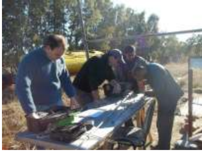
Ajustando la Ringo

Escribe: Carlos Romero LU8EKW - Instructor