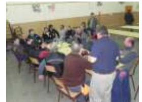
REUNION DE PRESIDENTES