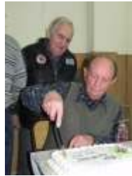
80 AÑOS LU4DFG